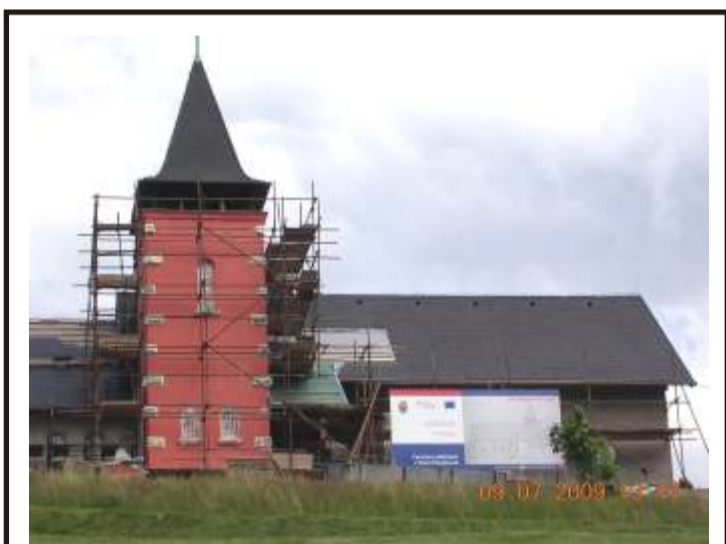
Stavební práce na rekonstrukci kostelíka již začínají mít podobu. V současné době je dokončena fasáda věžičky kostela, která bude sloužit jako rozhledna.

sakrálních památek by měla být prvním krokem k naplnění vize naučné stezky po kamenných památkách na základě zpracované projektové dokumentace v roce 2006, na kterou taktéž přispělo ministerstvo částkou 50% celkových nákladů.