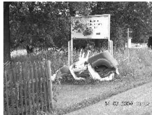
Černá skládka v lese v Horní Poustevně.