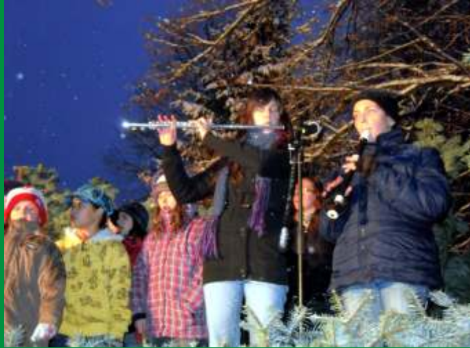
stavba smrku u potoka v D. Poustevně

Letošní vánoční strom jsme společně rozsvítili v pátek 26. listopadu. Jako již tradičně před první adventní nedělí. Nechyběl pěkný kulturní program, zpívání koledí a super nálada. Přejeme vám všem pevné zdraví, lásku a ničím nerušenou vánoční pohodu. Do nového roku pak jen vše nej nej vám, ale také našemu městečku.