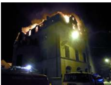
42 minut po půlnoci - pohled od lékárny.