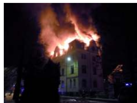
40 minut po půlnoci- pohled od mostku, oheň již zasáhl celou plochu střechy budovy.