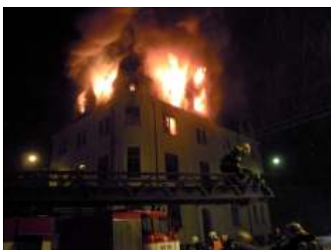
24 minut po půlnoci - žebřík s hasiči již na místě.