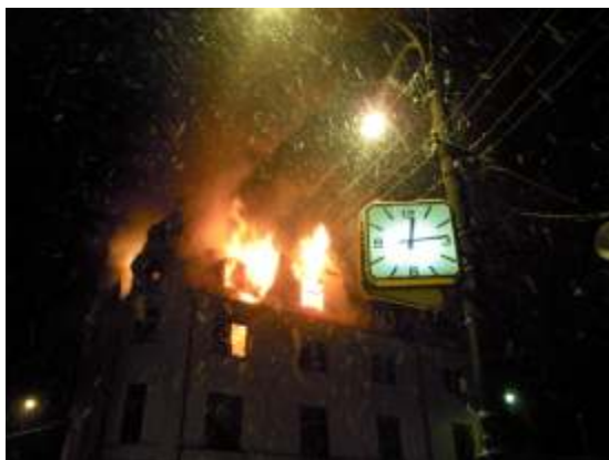
14 minut po půlnoci (hoří levá část budovy).

Smutný pohled na budovu po požáru druhý den ráno.