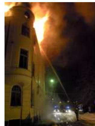
23 minut po půlnoci.