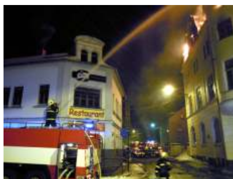
46 minut po půlnoci - pohled od řeznictví.