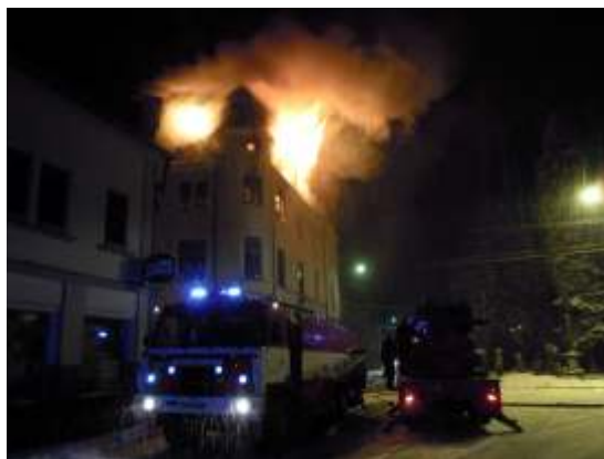
20 minut po půlnoci - pohled od autobusové zastávky.