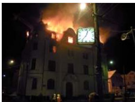
36 minut po půlnoci.