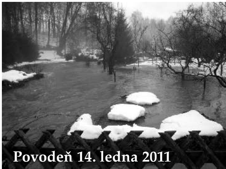
Povodeň 14. ledna 2011